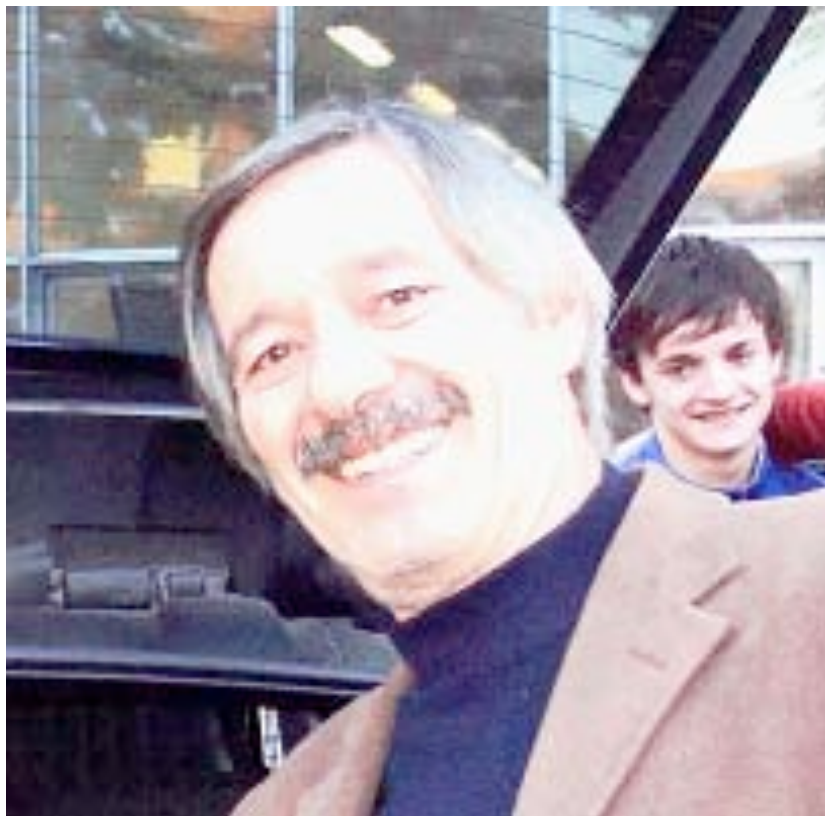
(Direttore dei Servizi Generali ed Amministrativi)