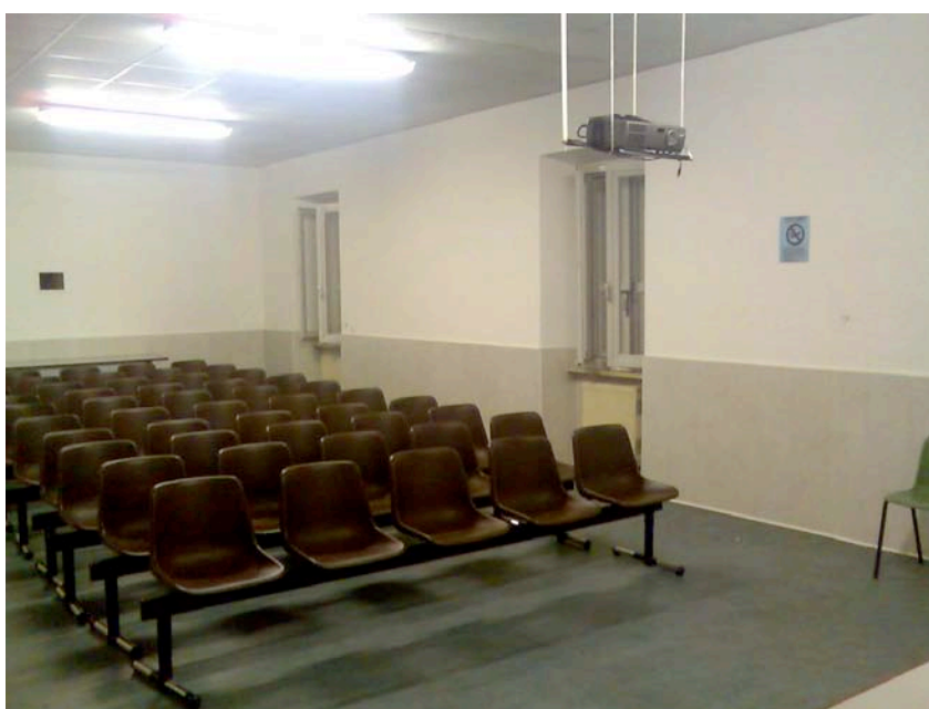
La sala proiezioni