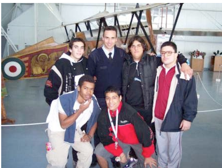
Al museo aeronautico di "Vigna di Valle"- Roma