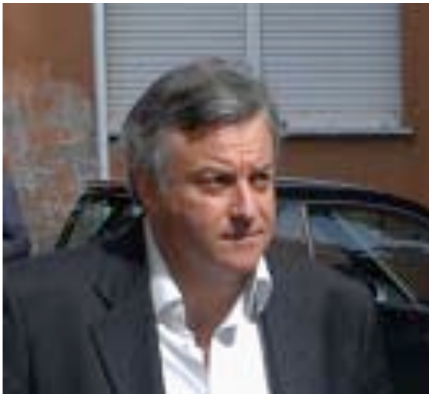
Educ. Roberto Ielpo