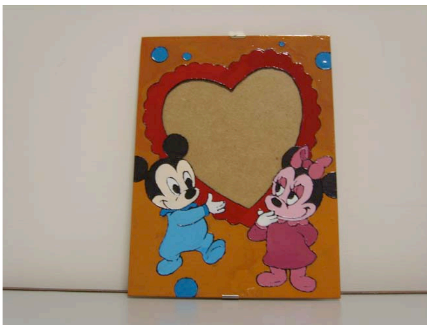
Uno dei lavori