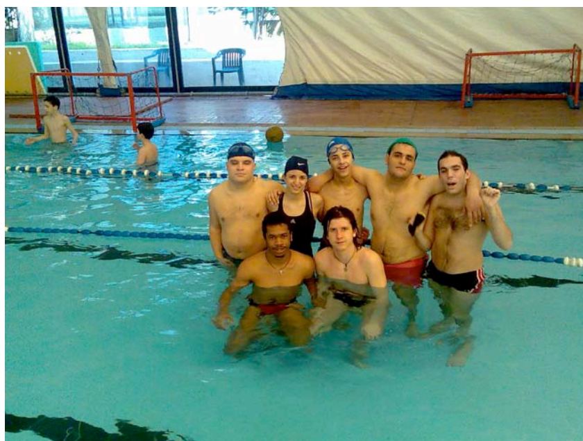
Allievi in piscina