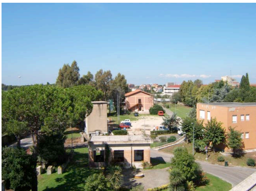
Veduta dall'alto del Casale