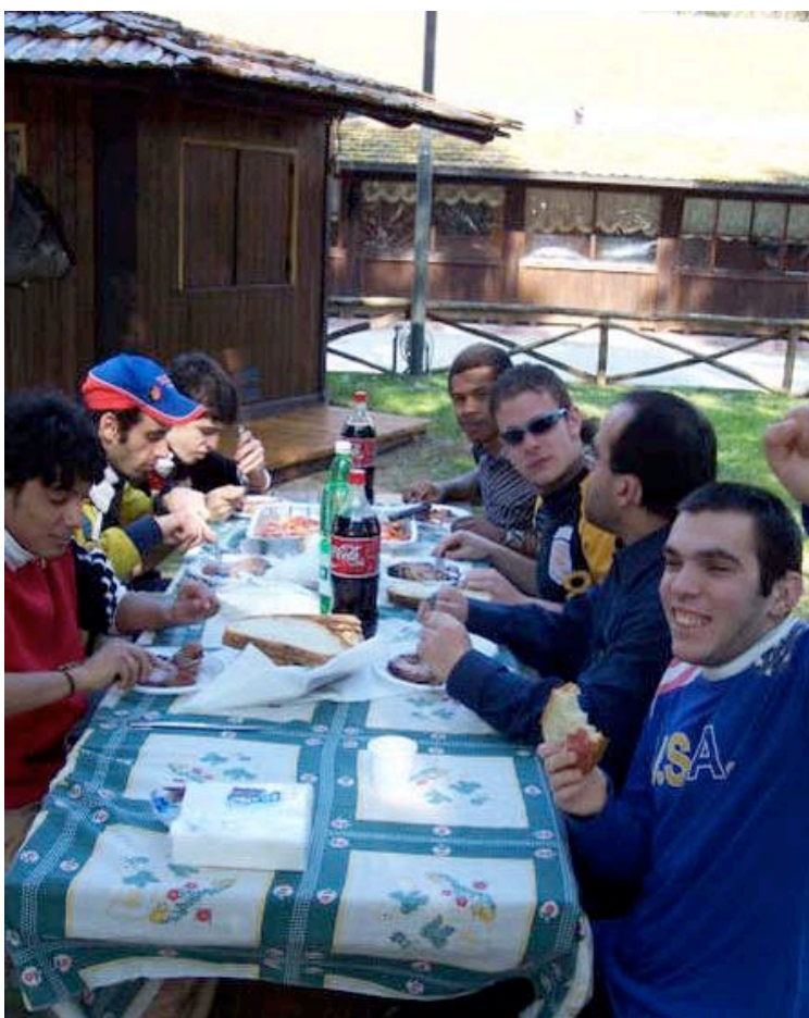
Allievi durante il pranzo ad una visita guidata.