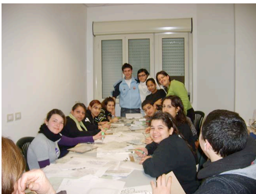
Allievi ed Educatrice durante il découpage